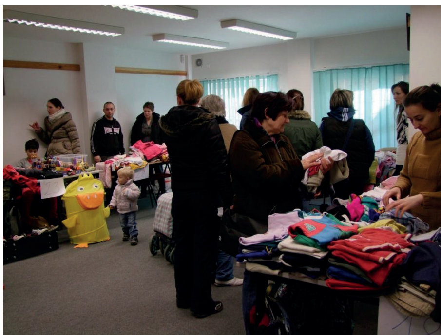
3. kép: Bababörze Hajdúnánáson