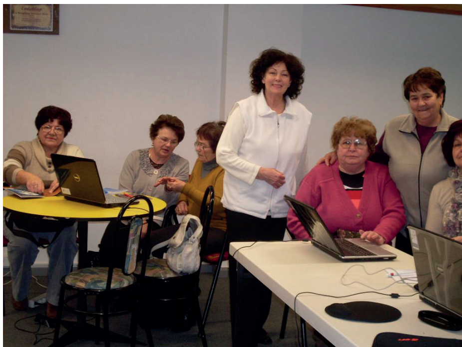
4. kép: Nyugdíjas Internet klub Hajdúnánáson