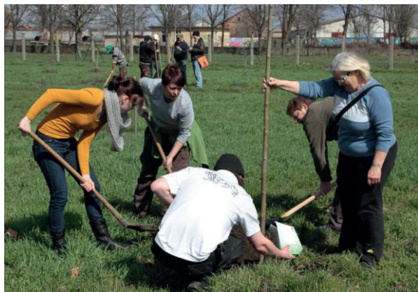
1. kép: Faültetés április 11-én a Fürdőkertben