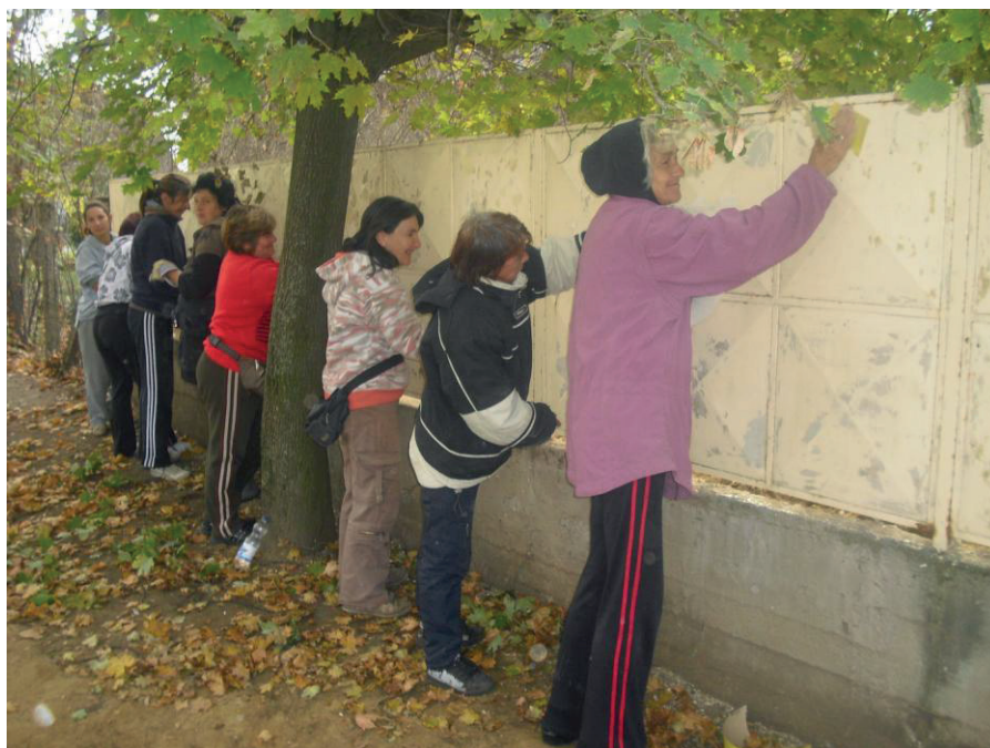
8. kép: a hajdúvidi óvoda kerítésének felújítása