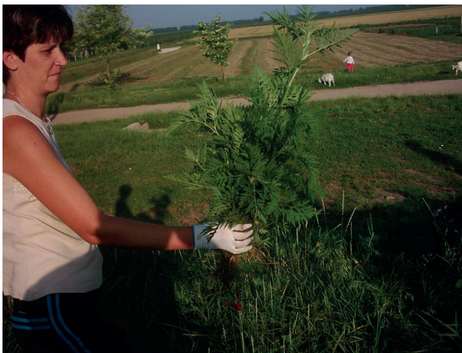
5. kép: Parlagfű irtás