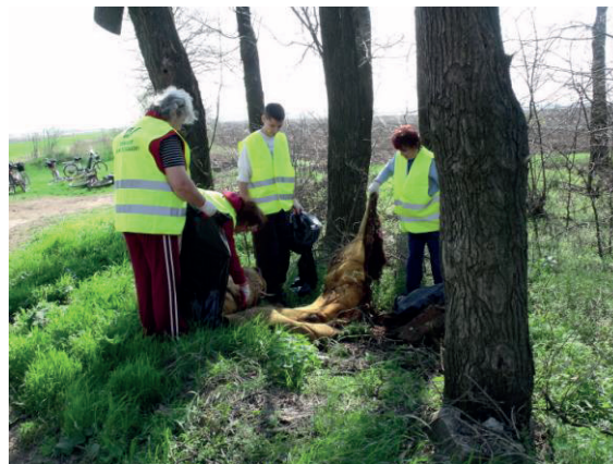
2. kép: Szemétszedés Hajdúviden