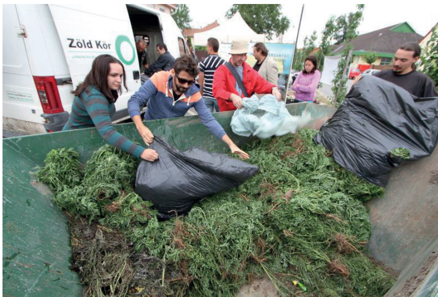
6. kép: A parlagfű begyűjtése