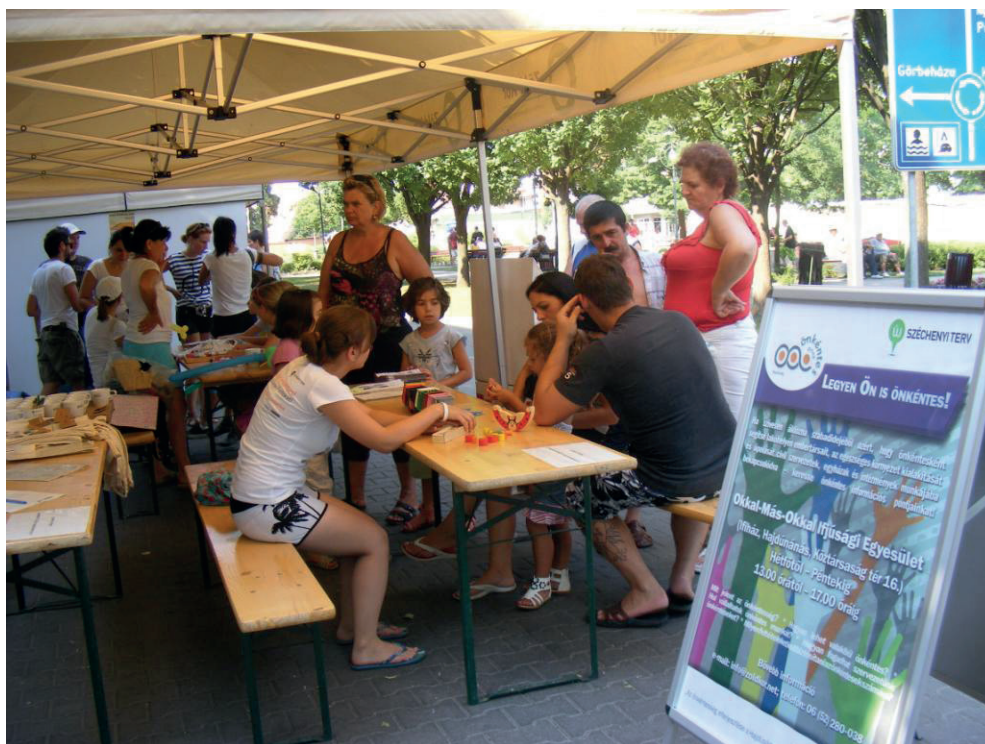
7. kép: Toborzás a Nánási Vigasságokon